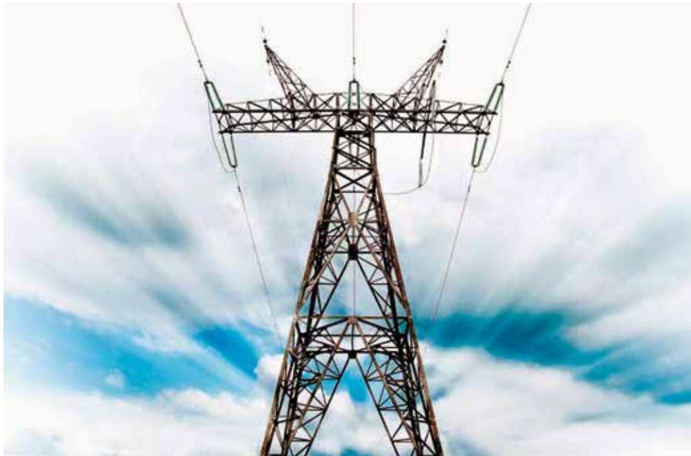
La investigación consideró la estructura completa de la red eléctrica del Sistema Interconectado Central y en una siguiente etapa incorporará el Sistema Interconectado del Norte Grande.