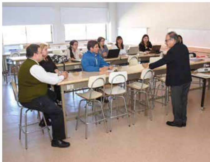
Los asistentes al seminario analizaron el uso de la microscopía virtual.

Especialistas valoraron también la importancia de esta herramienta en la clínica, durante el seminario realizado en el Campus Talca