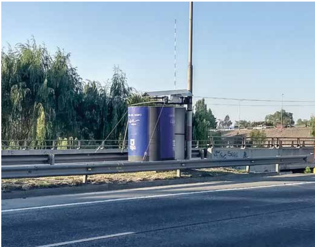
La salida sur de Curicó fue el lugar escogido para el funcionamiento de la turbina.