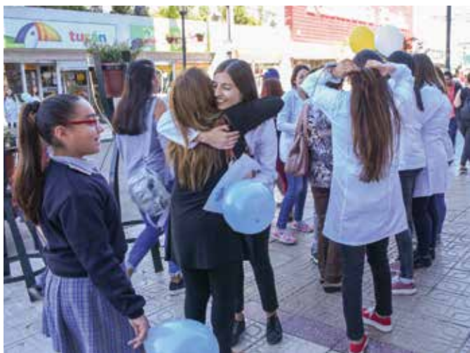
Alumnos de Enfermería regalaron abrazos, un gesto que sorprendió y que las personas acogieron con simpatía.

La VDE convocó a los estudiantes a dar la bienvenida a sus nuevos compañeros con acciones que no vulneren su dignidad