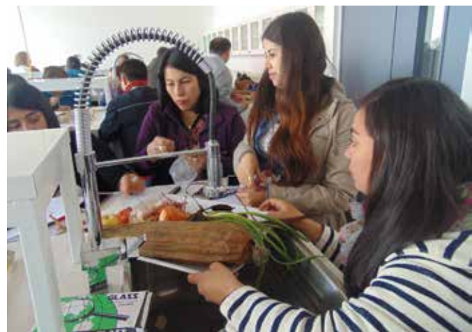
El Maule es una de las regiones con más participación de docentes en el taller Icec.

El programa académico ha capacitado a más de cien docentes de la Región del Maule durante los últimos tres años