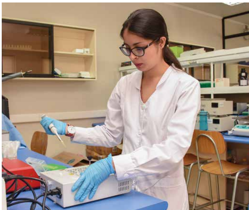
Los programas que contarán con becados de Conicyt corresponden a distintas áreas.