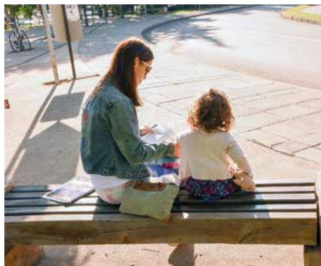
Los estudiantes cuentan ahora con medidas que permiten conciliar actividades académicas con el rol de padres y madres