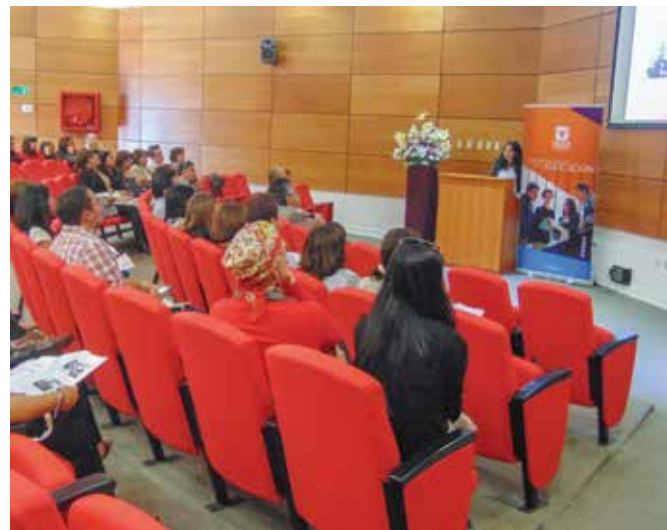
En este ciclo de prácticas, la Escuela de Pedagogías en Inglés enviará 89 estudiantes y 69 la Escuela de Ciencias Naturales y Exactas.