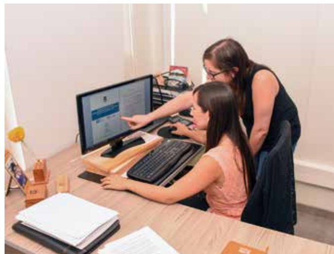
RSU tiene a cargo el programa de Prácticas Integrales.