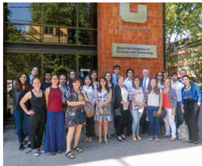
Profesionales y académicos participaron en esta conferencia de Rush Holt.