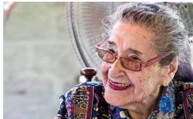
Aspectos relevantes de la vida y obra de Margot Loyola se destacarán en el programa conmemorativo de su nacimiento.

Está programada una exposición fotográfica del archivo personal de Osvaldo Cádiz, para iniciar el programa de celebración