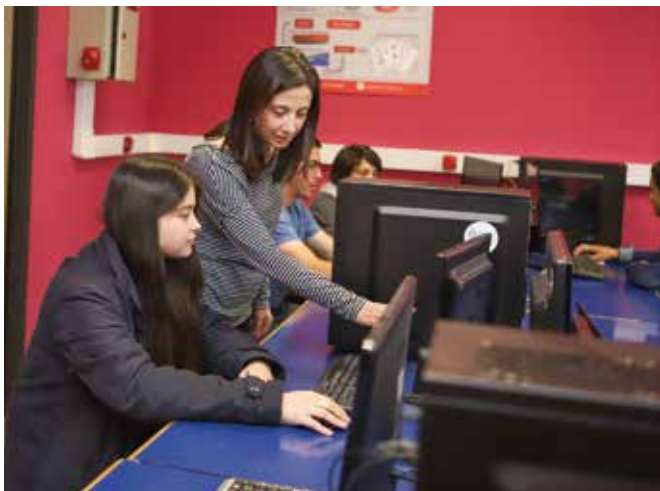
La Facultad de Ingeniería está promoviendo condiciones para la retención de los estudiantes.