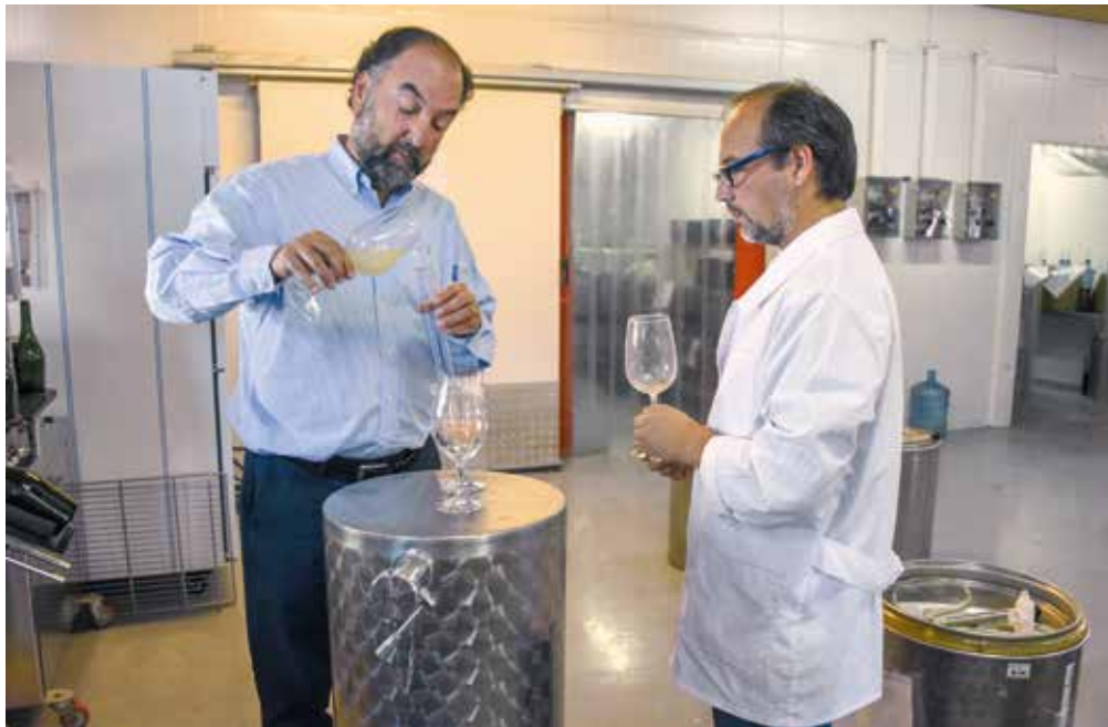
Las primeras vinificaciones se realizan en la bodega experimental del Centro.