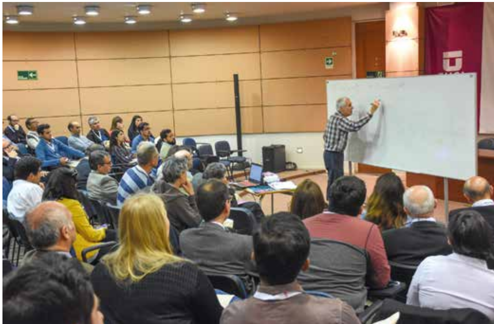
Los investigadores tuvieron un espacio para compartir conocimientos e ideas en las XIII Jornadas de Investigación y Postgrado.

la ecuación de los rankings internacionales, en los que presenta alrededor de un 40%, tanto en cantidad como en calidad. Pero además está demostrada su importancia en el desarrollo económico de los países, impacto que tiene relación con los recursos que con ese fin destinan el Estado y las empresas privadas”, expresó. Junto a lo anterior, lamentó que exista un alto grado de centralización, dado que el 60% de los aportes para la