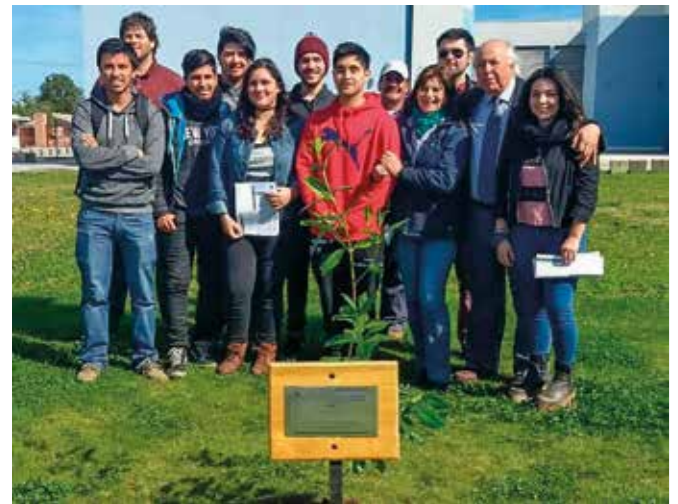
El recinto universitario cuenta ahora con un ejemplar de pitao.