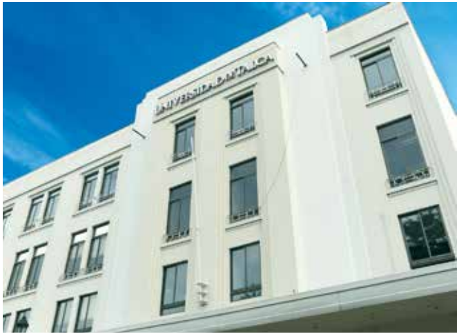
Partió el proceso para escoger la autoridad máxima de nuestra Corporación.

El 13 de marzo próximo se llevará a cabo el proceso de elección de rector de nuestra Universidad, de acuerdo a lo establecido por la Junta Directiva en su última reunión ordinaria. Conforme al calendario fijado, la inscripción de los candidatos deberá realizarse dentro de un plazo que se extiende entre el 29 de diciembre y el 8 de enero próximo. Previamente debe constituirse el Tribunal Califica-