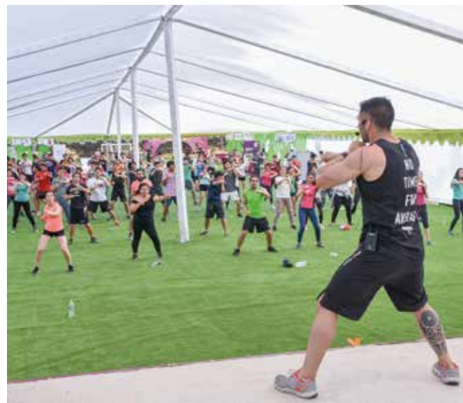
Como todos los años, la Feria tuvo una masiva participación de estudiantes.