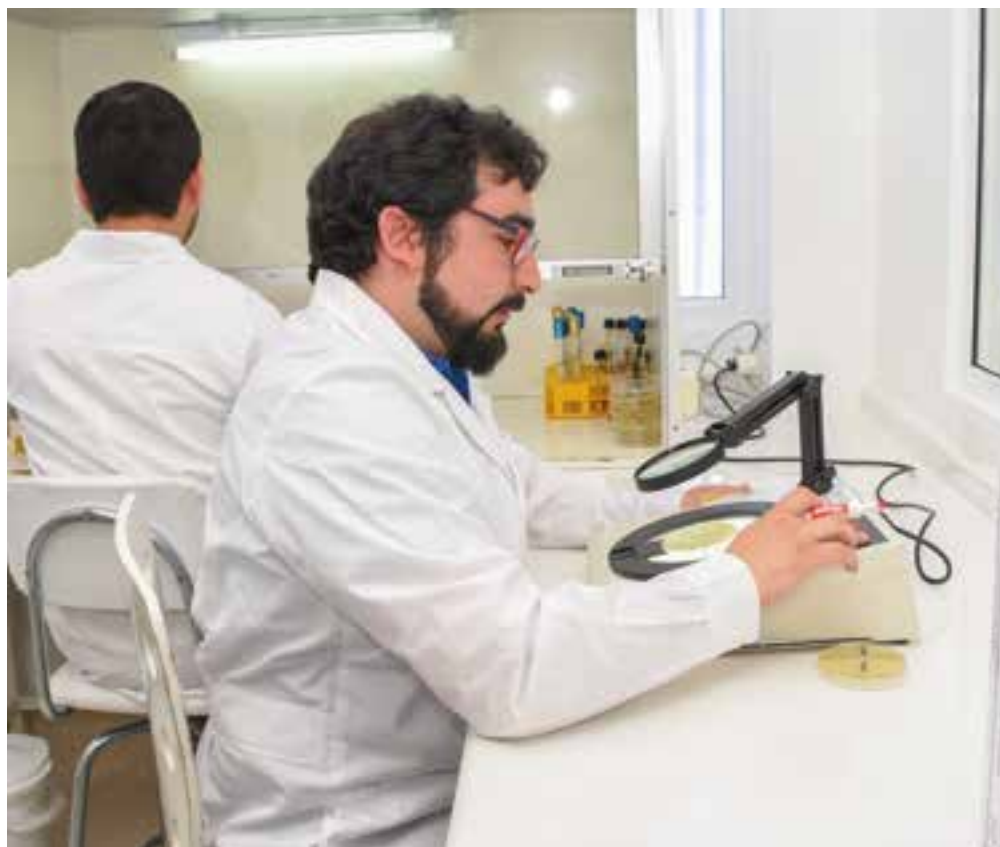
Las nuevas dependencias cubren una superficie de más de 300 metros cuadrados.

En las instalaciones se ubican las unidades que forman parte del Centro: el laboratorio de análisis, investigación y transferencia tecnológica, además de instalaciones administrativas, una sala de almacenamiento de muestras, otra de siembra y dependencias de repique preparación de