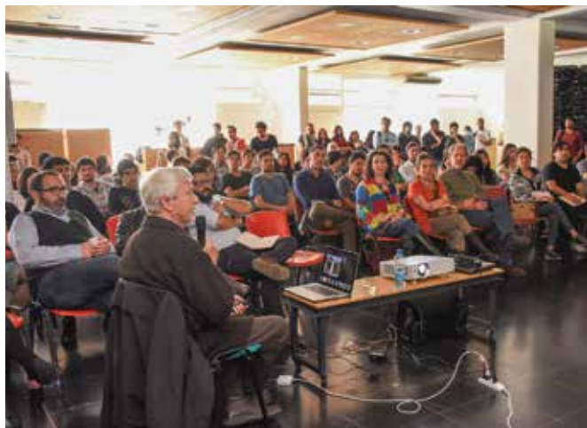
A Minke se le considera el “padre de la bioconstrucción” y su conferencia fue altamente apreciada.

Techos verdes, jardines verticales, paredes de fardos de paja y barro, forman parte de un tipo de arquitectura que ha impulsado Gernot Minke, considerado el padre de la bioconstrucción.