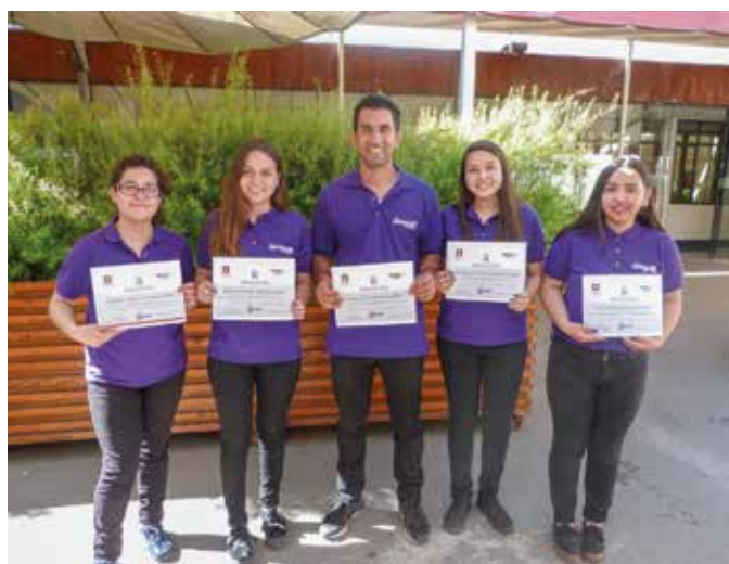
Los participantes ganaron en aprendizaje más allá de lo académico.

Siete grupos participaron de la actividad, cuyo objetivo fue permitir que los estudiantes apliquen los conocimientos teóricos adquiridos