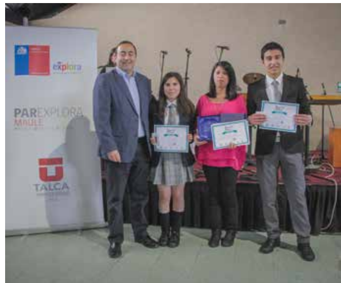
Ganadores de la competencia regional que van al Congreso Nacional de Ciencia y Tecnología.