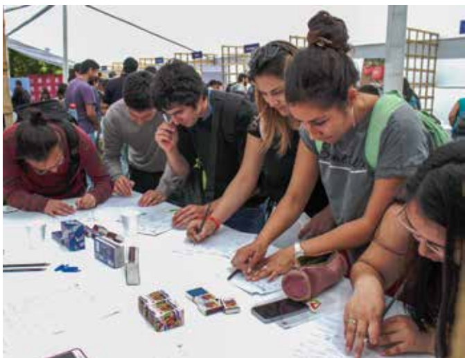
Los jóvenes se interiorizaron sobre la oferta de prácticas y empleos.

En la Facultad de Ingeniería tuvo lugar la 3ª Feria Laboral y de Prácticas en que diversas empresas presentaron sus ofertas