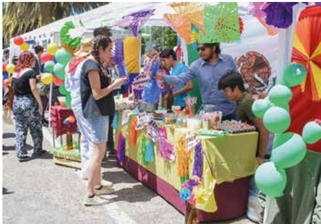
Los estudiantes extranjeros nuevamente tuvieron la oportunidad de presentar comidas y música de sus respectivos países.

Instancias de acercamiento con el mundo académico y la comunidad de estudiantes extranjeros, hubo en esta actividad que estuvo a disposición de los alumnos