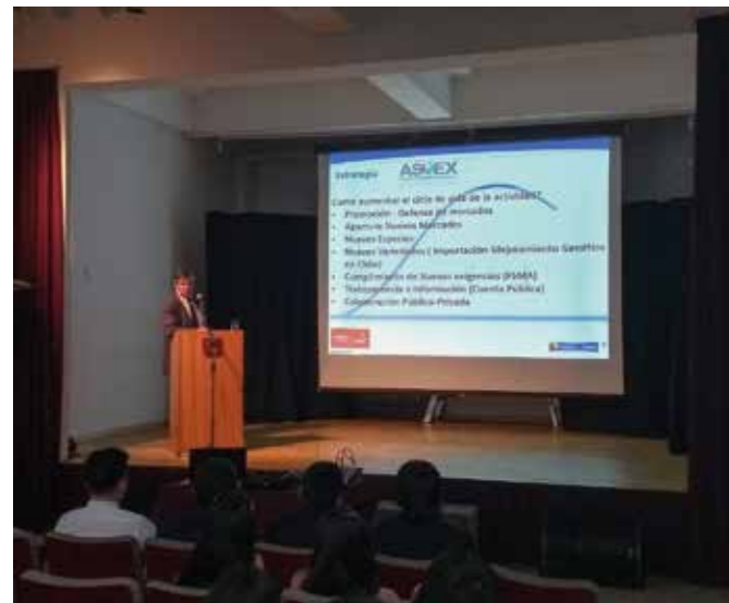
De acuerdo al ejecutivo, se espera que las cerezas aumenten por sobre el 20% sus ventas al extranjero en esta temporada.