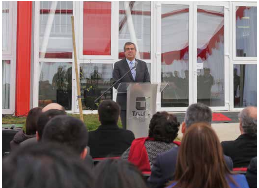
En el Campus Talca está ubicado el edificio de Comunicaciones corporativas que alberga a sus diversos medios.

“En la medida que visibilicemos adecuadamente nuestro trabajo y entreguemos a la comunidad contenidos im-