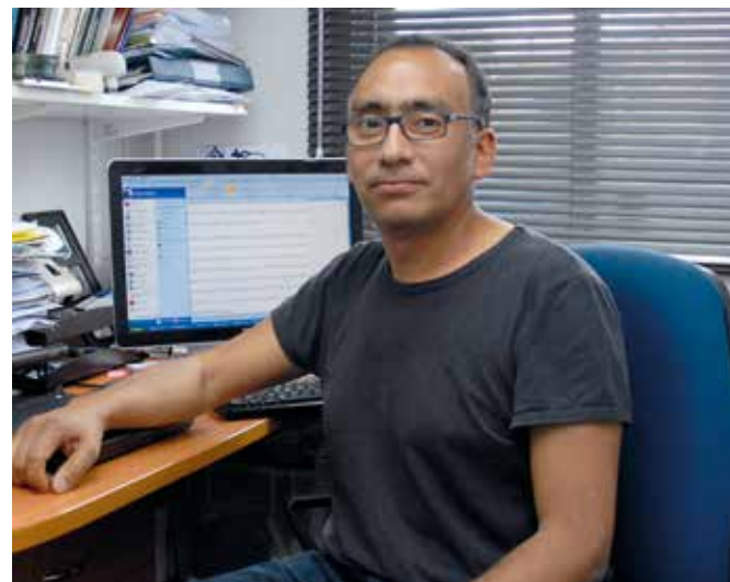
El director del ICB indicó que de manera permanente se realizan actividades de difusión de las ciencias biológicas.