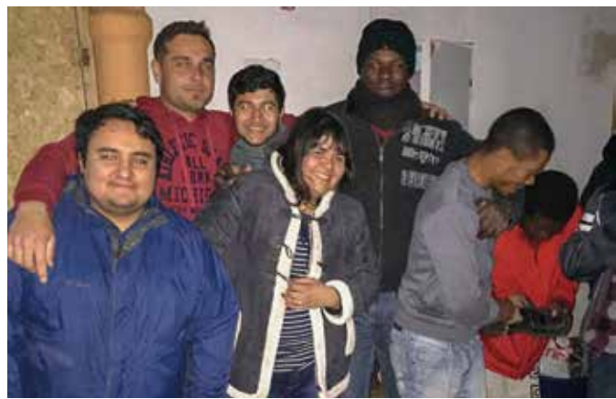
La donación fue recibida por representantes de la comunidad beneficiada que vive en el sector Diego Portales.

La actividad solidaria consistió en recolección y entrega de ropa de invierno a cerca de 35 inmigrantes.