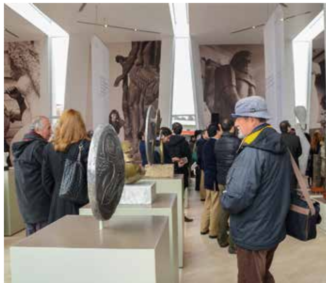
El público ha podido disfrutar de visitas guiadas, noche de los museos, cuentacuentos y exhibición de documentales sobre la vida de la artista, entre otras actividades.