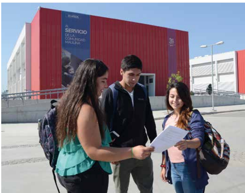
Acuerdo firmado reconoce énfasis que la Universidad está colocando en la formación de profesores.