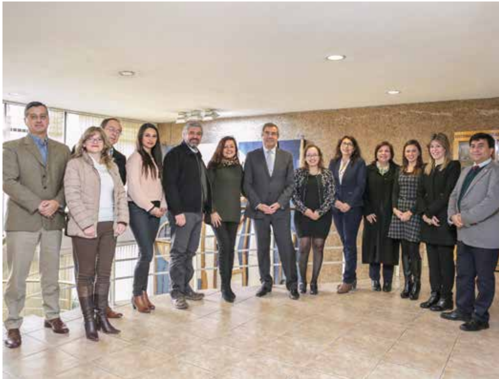
Participantes en el noveno encuentro de la red de Educación Continua del Cuech.

Esta instancia se creó a fines de 2015, con el fin de constituir una alianza entre las institucio-