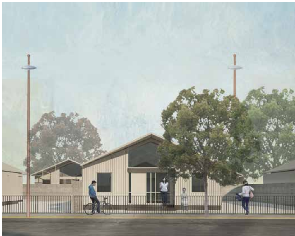
Las viviendas sociales serán de mejor calidad desde el punto de vista constructivo, espacial y de la sustentabilidad.

En forma especial destacó la sostenibilidad del proyecto, que utiliza materia prima y mano de obra local, lo que abarata los costos y genera empleo. “También el hecho que sea una vi-